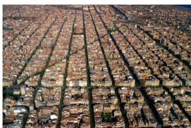
Barcelona: L'Eixample. La quadrícula només es veu alterada per el pas de l'Avinguda Diagonal.

Seguint en la tradició dels anys anteriors el tema central del concurs estarà relacionat amb la celebració d'aquest dia. Es tracta de cercar imatges que posin de manifest la relació entre les matemàtiques i l'entorn de la ciutat , des de diferents vessants .